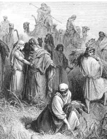
Ruth, la mujer inmigrante trabajadora fue finalmente aceptada por los ancianos de la comunidad.

Amán es que este rico forastero no le ofrezca el respeto que él cree que su posición merece. Amán trama destruir a todos los judíos, diciéndole al rey que esa gente es diferente y por lo tanto es peligrosa y no es confiable (3:1-11). Pero Mardoqueo descubrió un complot de asesinato, probando su lealtad a la corona (2:21-23), y planeó salvar a su gente por medio de Ester (capítulos 4, 8-10). Ni Ester ni Mardoqueo parecen haber pensado en regresar a la tierra de sus antepasados.