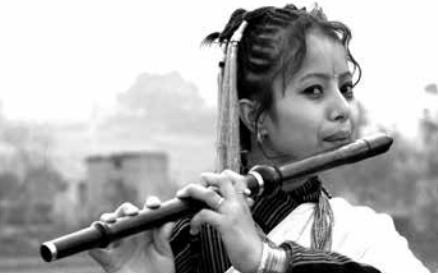
La inmigración trae personas de diferentes expresiones culturales.

El inmenso fenómeno demográfico actual de “gente en movimiento” tiene repercusiones a todos los niveles en todos los países. Para las comunidades cuyos miembros emigran, esa pérdida puede tener como resultado la disminución de mano de obra, la fuga de cerebros, y la interrupción de la vida familiar. Para las comunidades que reciben inmigrantes, la afluencia de recién llegados ocasiona presiones imprevistas en mercados de trabajo, instituciones educacionales, centros de salud, y el cumplimiento de las leyes. Idiomas y expresiones culturales diferentes van contra la corriente de identidades culturales ya establecidas, lo que a su vez puede despertar sentimientos etnocéntricos contra los forasteros. 1 Al mismo tiempo, aquellos que acaban de llegar enfrentan una cantidad de difíciles desafíos. Luchan con su propia identidad y autoestima al tratar de sobrevivir económicamente e integrarse en un medio extraño.