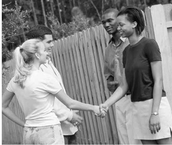
Christians should seek constructive change with humility, charity and justice.

Los cristianos deben buscar cambios constructivos con humildad, caridad y justicia. Esto puede ser hecho con respeto a las autoridades y sin embargo, también comprometiéndose con el más alto llamado de Dios a su pueblo de ser una bendición para el mundo. Jesús y el resto del Nuevo Testamento nos muestran un mejor camino puesto que somos parte del reino de Dios en la tierra.