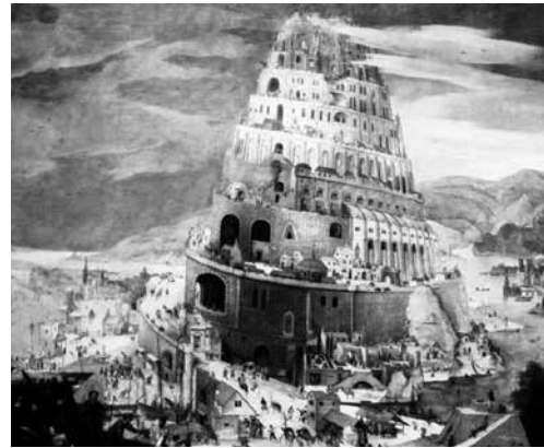
La torre de Babel, inicio de la dispersión de los seres humanos por todo el mundo.

La Biblia contiene asombrosas historias de determinación y creatividad. José supera circunstancias injustas en Egipto, se levanta para llegar a ser el segundo después del Faraón, y ayuda a salvar esa tierra del hambre (Génesis 39-41). Prepara el camino para su padre, Jacob, y para el resto de su clan para establecerse en Gosén (Génesis 47:1-12). Noemí y su familia salen de Belén por causa de la hambruna y emigran a Moab, al otro lado del río Jordán. Diez años más tarde, para entonces siendo viuda y estando sus dos hijos muertos, Noemí regresa a Belén con Rut, su nuera. Rut en este nuevo contexto es inmigrante. Va a los campos a recoger espigas con